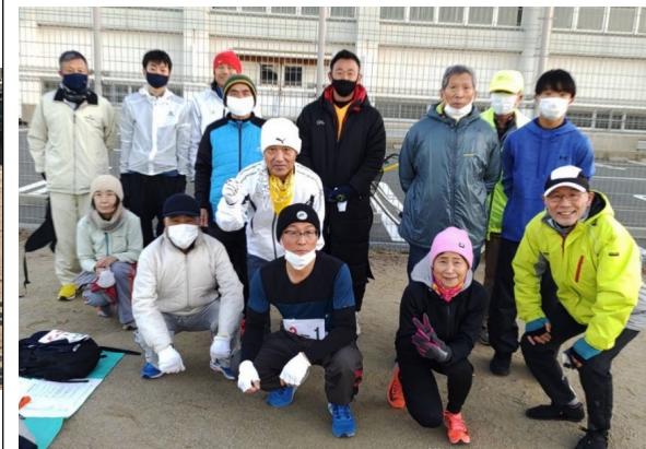
1月8日(土)成人式駅伝