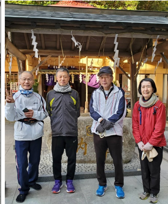
1月2日宮地嶽神社参拝 Jogging