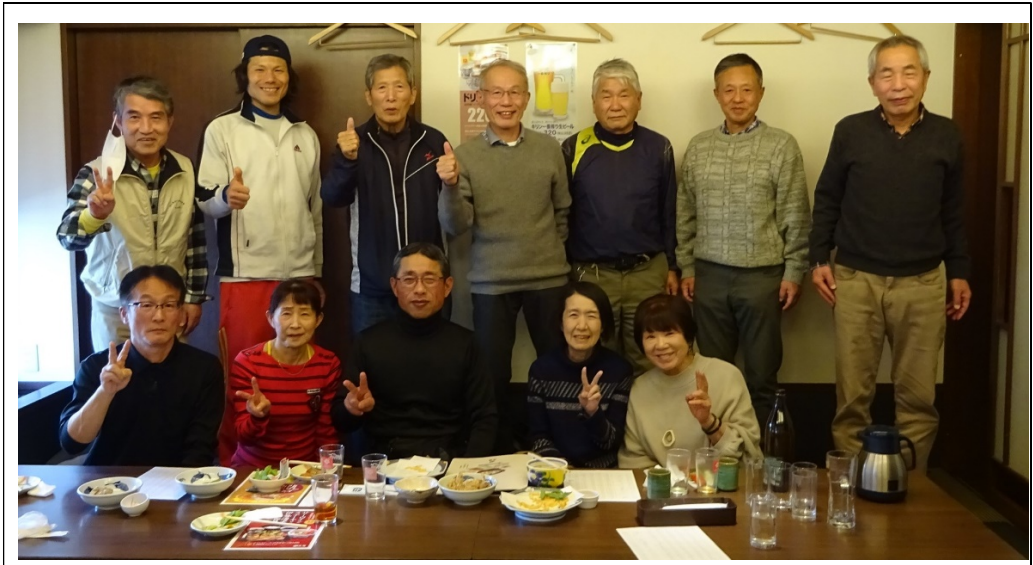
成人式駅伝後 新年会 (於：庄や)