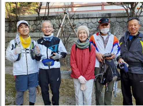
土曜ラン 香椎宮⇒スタバ