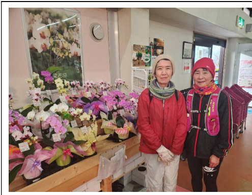
土曜ラン あんずの里